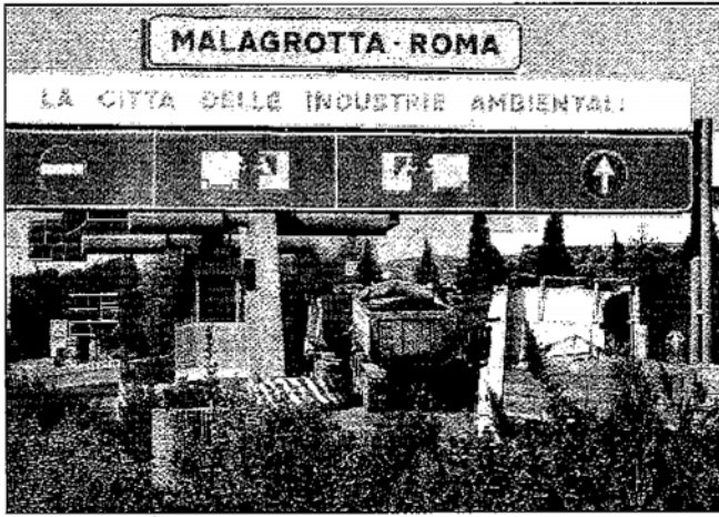
La discarica di Malagrotta aperta in proroga fino a giugno

In progetto, la riqualificazione dell'area di Tor Bella Monaca annunciata dal sindaco Alemanno