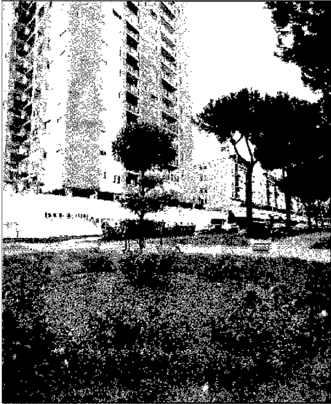
Nuovi marciapiedi, aree verdi, alberi e panchine abbelliscono il boulevard di via Saponi